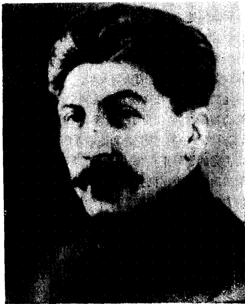
二十年代的斯大林同志