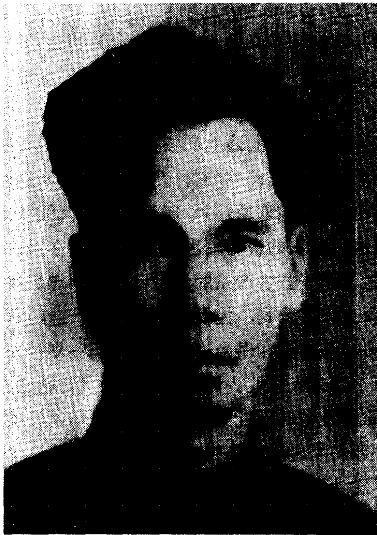
二十年代的胡志明同志

列宁主义，第一次世界大战后就成为社会的重要政治力量。二十年代末，民族斗争和阶级斗争日趋激烈，工农运动蓬勃开展，工人阶级在斗争中迅速成长。成立工人阶级的政党以组织和领导一切爱国和进步力量，已成为当时越南革命的迫切要求。