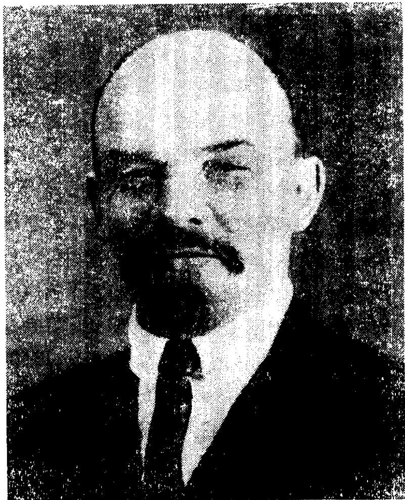
十月革命时期的列宁同志

又说，“只有承认阶级斗争、同时也承认无产阶级专政的人，才是马克思主义者……必须用这块试金石来测验是否真正了解和承认马克思主义”。 ①