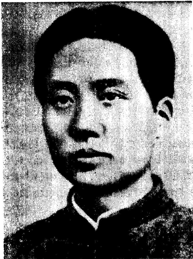
中国共产党创建时期的毛泽东同志