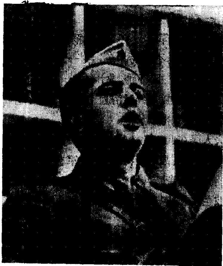
反法西斯战争时期的霍查同志

人民并肩作战。一九四五年初，菲律宾人民配合美军登陆发动了总反攻，解放了大片国土，在三个省建立了人民政权。